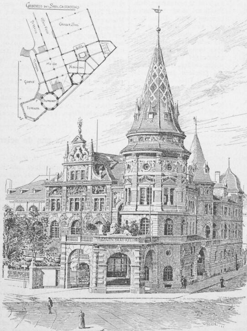
Aus „Städtische Wohn- und Geschäftshäuser“.

Architekt: Prof. Fr. von Thiersch in München.