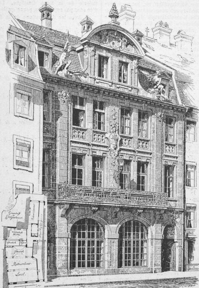
Aus „Städtische Wohn- und Geschäftshäuser“.

Architekt: Prof. Gabriel Seidl in München.