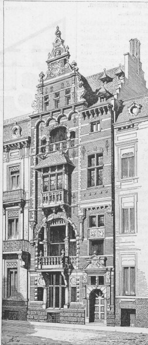
Aus „Städtische Wohn- und Geschäftshäuser“.