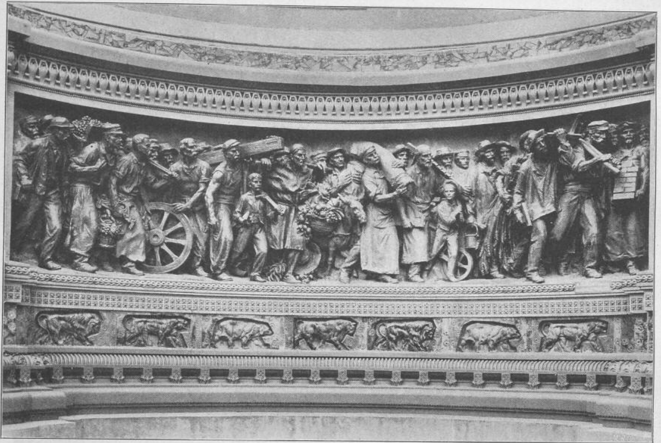
Fries (Basrelief) am linken Seitenausbau des Haupteinganges. (Place de la Concorde.)

Bildhauer: Guillot (Zug der Arbeiter), Jouve (Thiere).