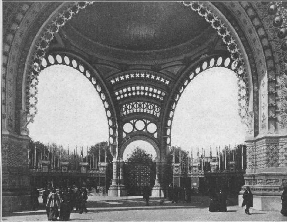
Innenansicht des Haupteingangs an der Place de la Concorde.