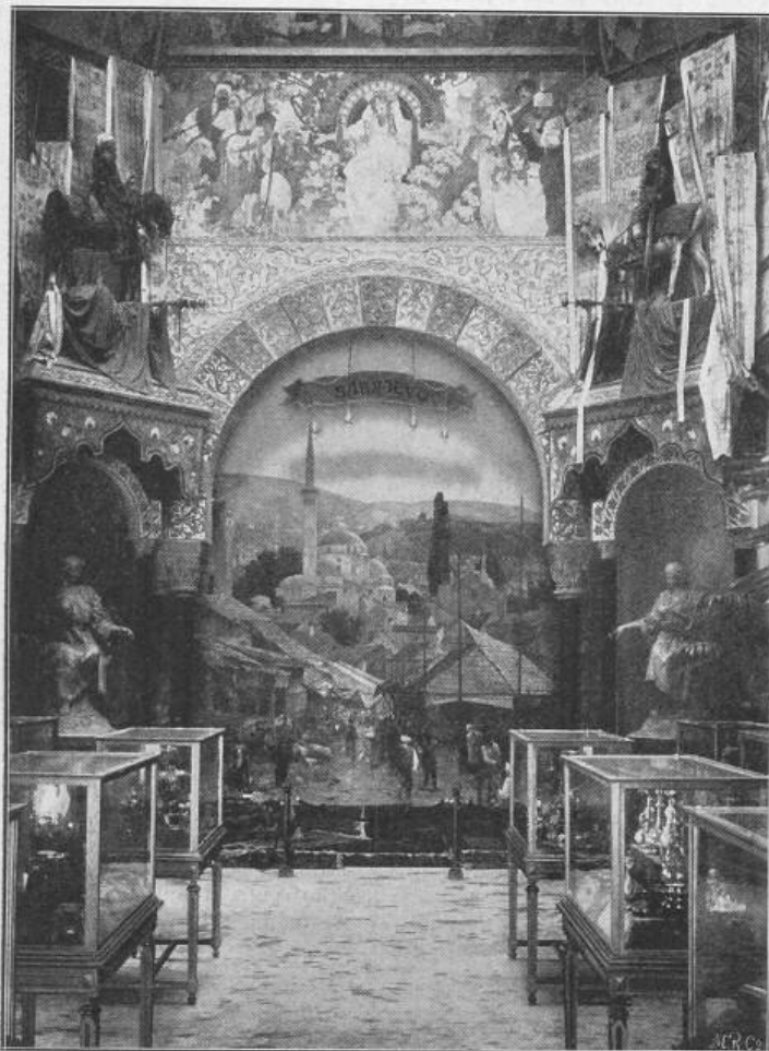
Fig. 7. Halle im Pavillon von Bosnien-Herzegovina.