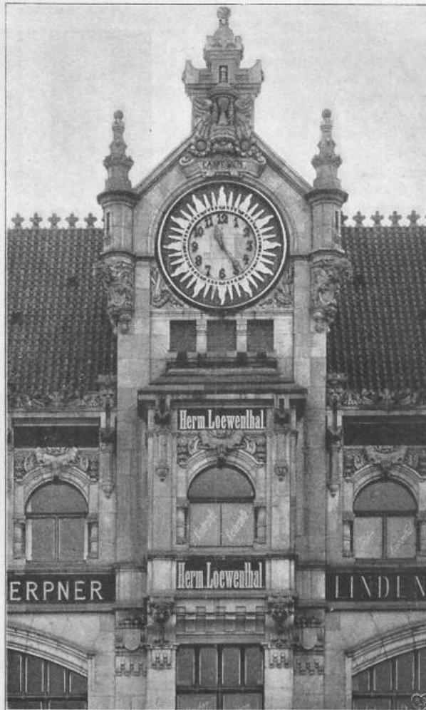
Fig. 30. Haus zur Berolina, Hausvoigteiplatz 12.

Schon diese kleine Tabelle spricht für sich selbst und bedarf kaum eines weitem Kommentars. Sehr einlässlich sind die Verhältnisse namentlich in Berlin untersucht worden, wo vom Direktor des dortigen meteorologisch-magnetischen Observatoriums, Professor von Bezold, lebhaft Einsprache gegen die Anlage einer elektrischen Bahn im nähern Umkreise