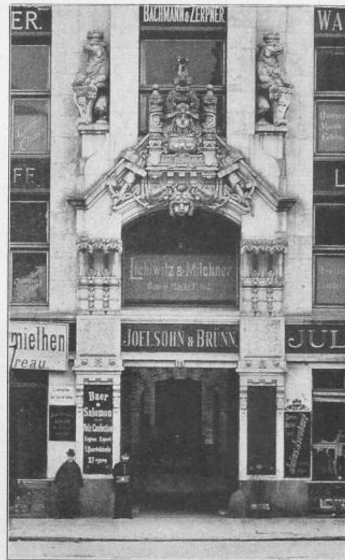
Fig. 29. Haus zur Berolina, Hausvoigteiplatz 12. Arch.: Allerthum & Zadek (Krause) in Berlin.