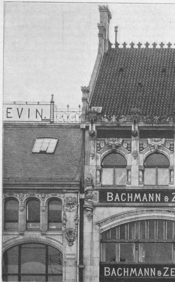
Fig. 32. Detail der Häuser Hausvoigteiplatz 12 u. 13.

ermagnetischen Beobachtungen hinfällig. Hier handelt es sich darum, die erdmagnetischen Erscheinungen unverfälscht und ungetrübt zur Aufzeichnung zu bringen. Ich gebe mich der Hoffnung hin, dass es den einmütigen Bemühungen von Wissenschaft und Technik gelingen werde, den elektrischen Bahnbetrieb in einer Weise umzugestalten und zu vervollkommen, dass die Rückleitung durch die Erde vermieden werden kann. Sowie dieses Ziel erreicht ist, wird auch der unnatürliche Zwiespalt verschwinden, in den gegenwärtig Wissenschaft und Technik miteinander geraten, die doch ihrem ganzen Wesen nach aufeinander angewiesen sind und dem bisher beide ihre grössten Erfolge zu verdanken hatten.»