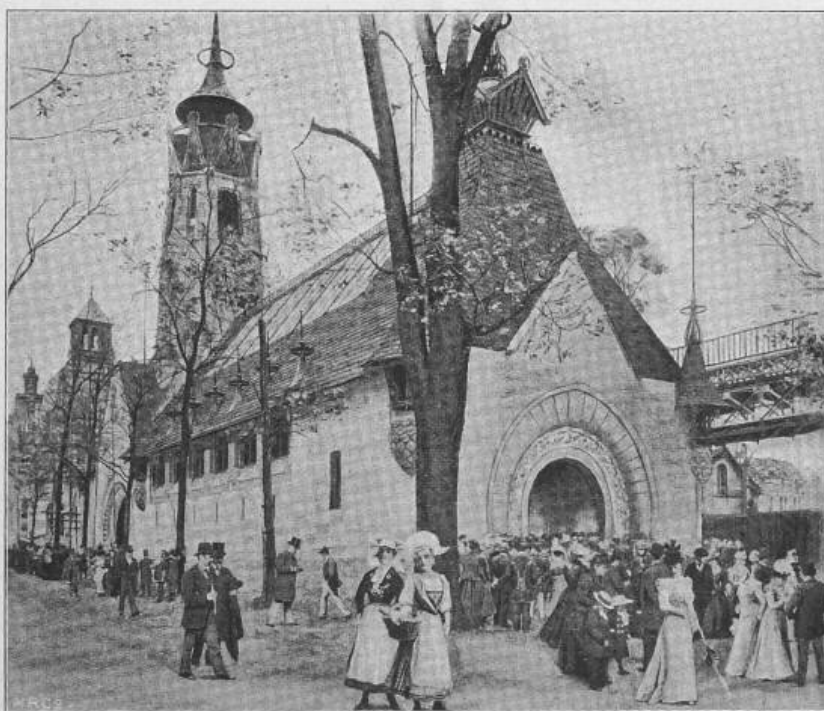
Fig. 27. Der finnländische Pavillon.