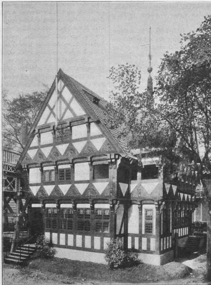
Fig. 26. Der dänische Pavillon.