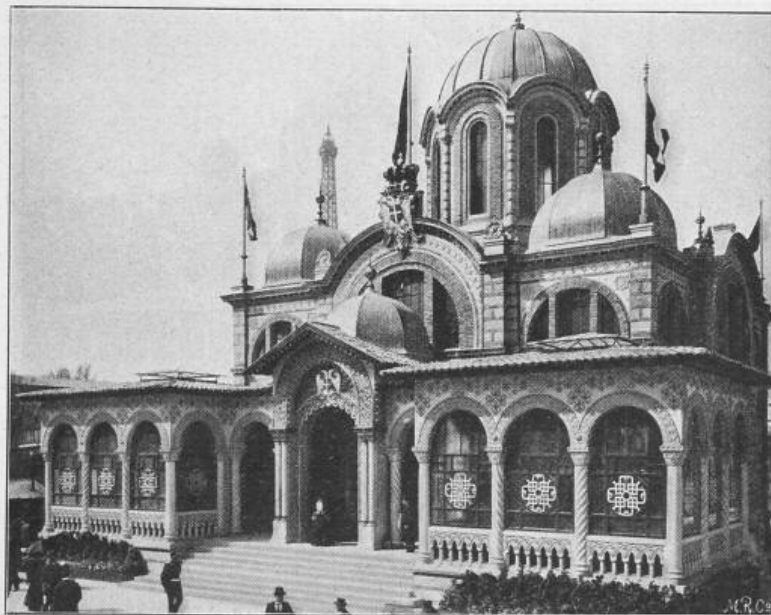
Fig. 25. Der serbische Pavillon.