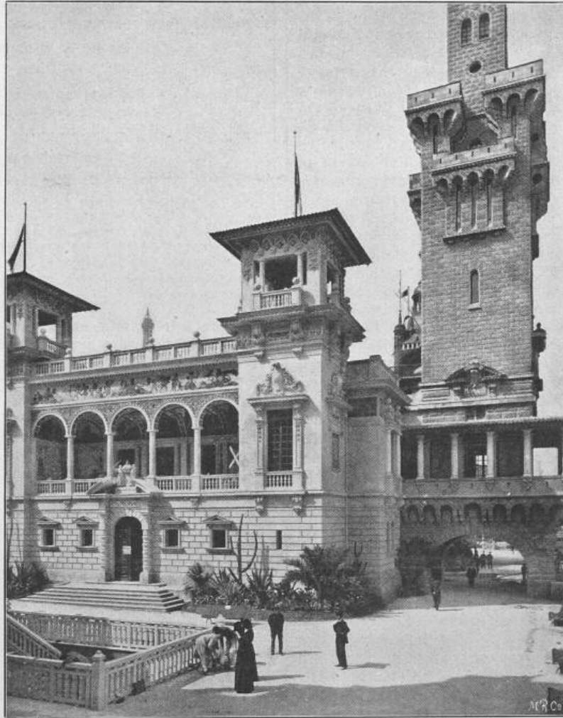
Fig. 21. Pavillon des Fürstentums Monaco.

Der dänische Pavillon, mit welchem die Reihe an der Invaliden-Brücke anfängt, hat die Form eines jütländischen Bürgerhauses aus dem XVII. Jahrhundert (Fig. 26). Sichtbare Holzkonstruktion mit weiss geputzten Füllungen, wie man solche in vielen Gegenden Deutschlands trifft. Dieses bescheidene und stimmungsvolle Werk rührt von den Architekten Koch, Bindesboll und Petersen her. — Portugal