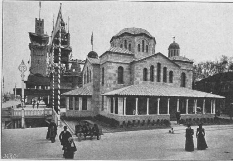
Fig. 24. Der griechische Pavillon.