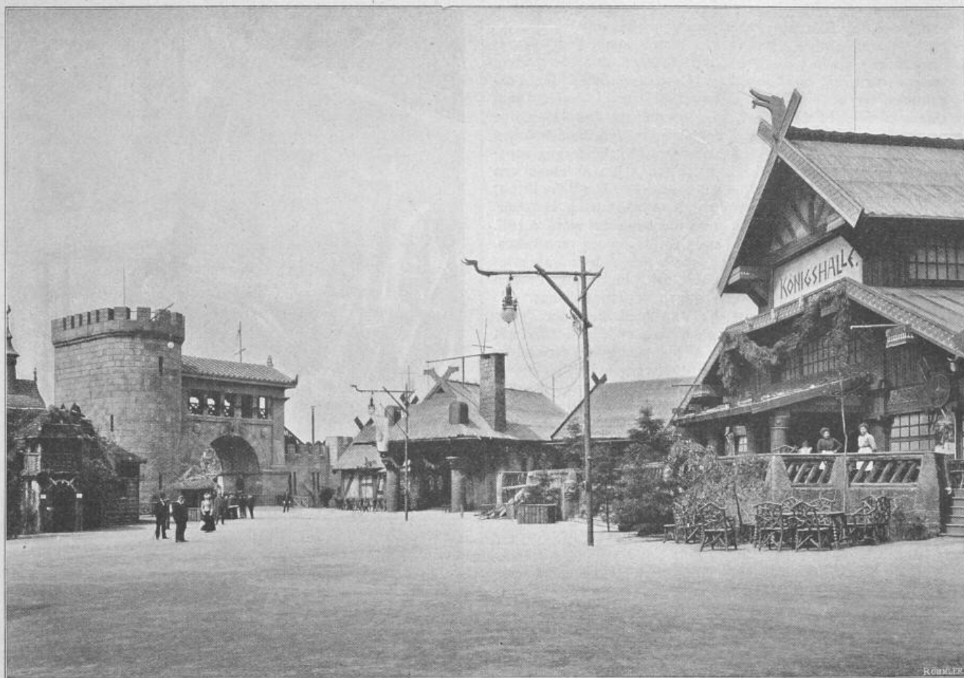
Deutsche Bauausstellung in Dresden. — Details vom Vergnügungseck.