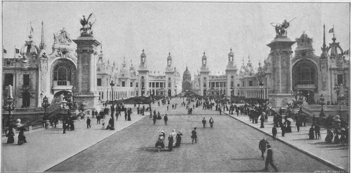
Fig. 31. Invaliden-Esplanade, von der Alexander-Brücke aus gesehen.

in Paris. Polytechnikum in Pittsburg (V. St.) — Konkurrenzen: Neubau eines Knabensekundarschulhauses in Bern. Central-Museum in Genf. — Preisausschreiben: Preisausschreiben des Vereins für Eisenbahnkunde zu Berlin. — Nekrologie: † H. V. von Segesser. — Vereinsnachrichten: Zürcher Ingenieur- und Architekten-Verein. Gesellschaft ehemaliger Studierender: Stellenvermittlung.