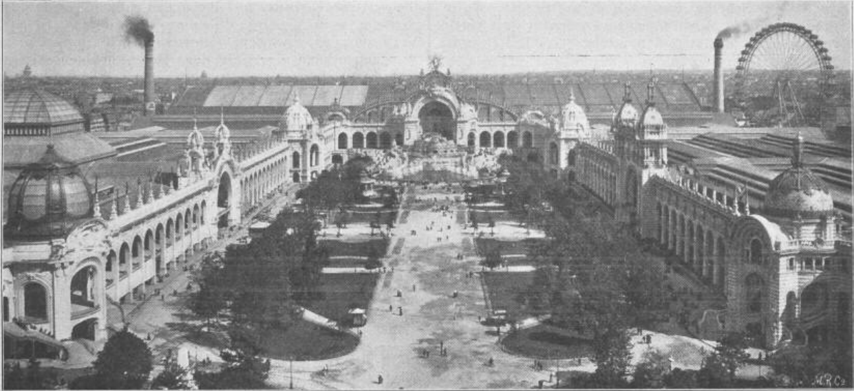
Fig. 37. Das Marsfeld, von der ersten Galerie des Eiffelturms aus gesehen.