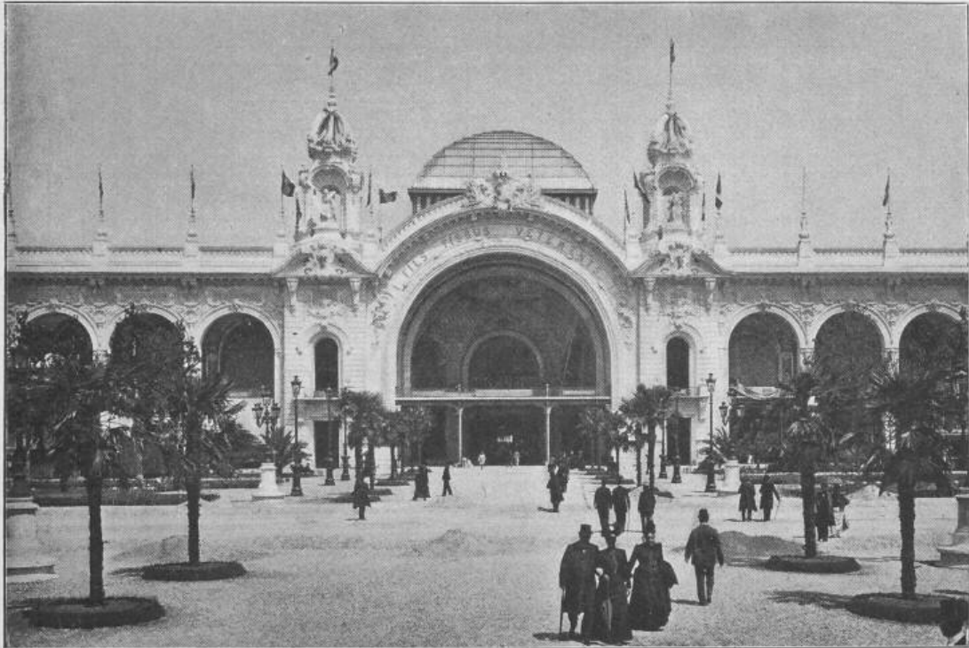
Fig. 40. Palast für Gewebe und Kleidung. — Mittelbau.