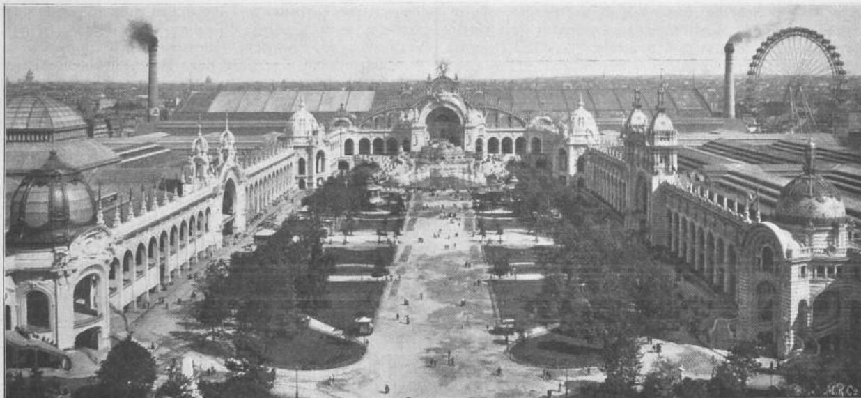
Fig. 37. Das Marsfeld, von der ersten Galerie des Eiffelturms aus gesehen.