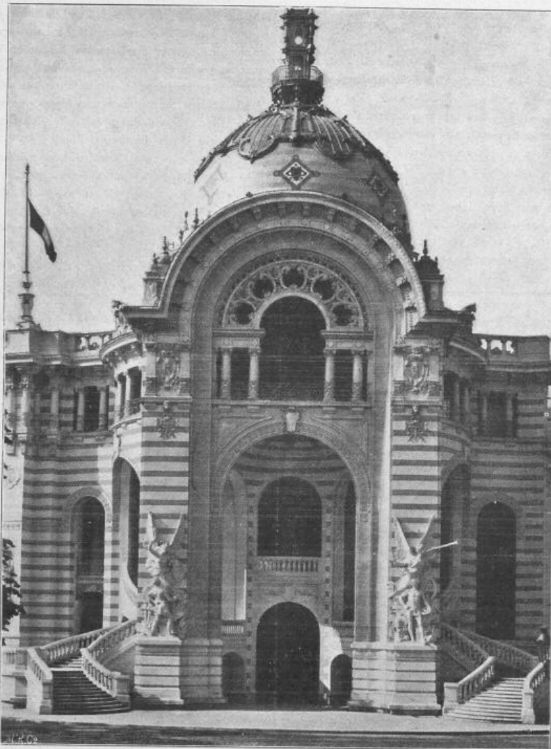
Fig. 39. Palast für Ingenieurwesen und Transportmittel. — Eckpavillon.