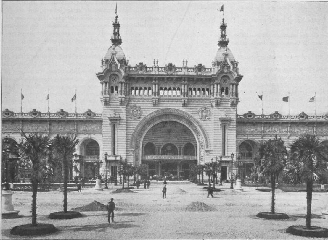
Fig. 38. Palast für Ingenieurwesen und Transport-Mittel. — Mittelbau.