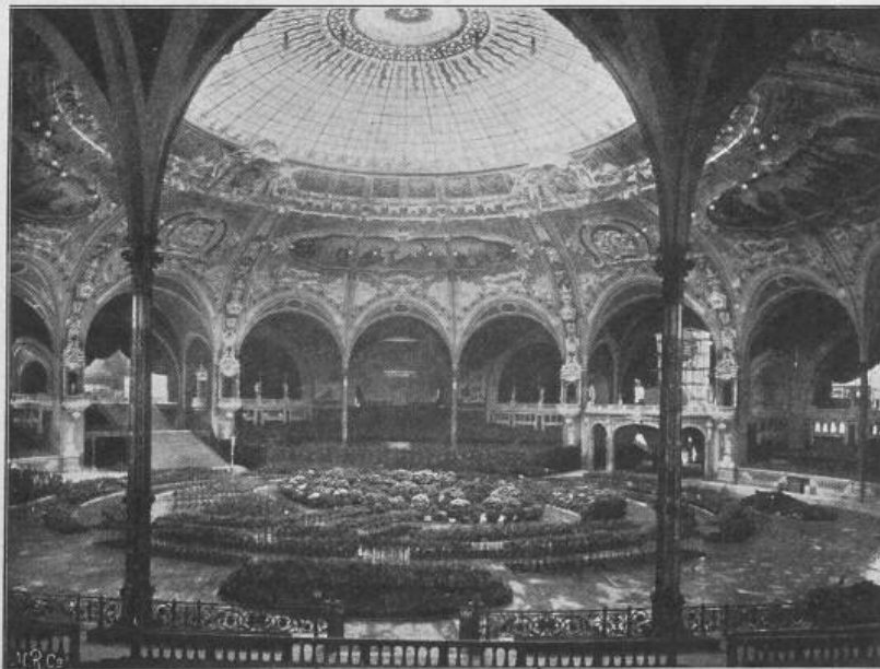
Fig. 42. Der grosse Festsaal. — Architekt: Raulin.

Die Umlegung eines Kamines. In der «Schweizerischen Bauzeitung» vom 17. Nov. 1900 Seite 198 ist die Umlegung eines Kamines besprochen und hierbei als beachtenswert hervorgehoben, dass die oberen Teile des Kamines beim Umfallen desselben sich von den unteren Teilen trennten und in dem resultierenden Schuttkegel oben auf diesen unteren Teilen zu liegen kamen und nicht neben ihnen. Der Augenblick der Trennung ist in einer sehr schönen Photographie dargestellt; die Trennungsstellen sind deutlich in \frac{1}{3} und in \frac{2}{3} der Höhe zu erkennen.