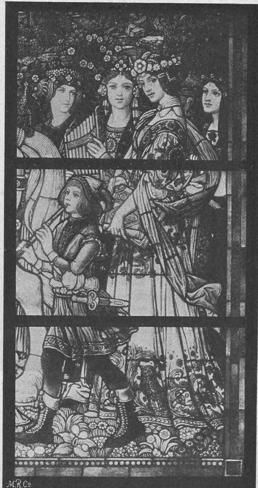
Abb. 1. Frühlingszug. Fragment aus dem grossen Glasfenster des deutschen Hauses an der Weltausstellung zu Paris.

schaft u. a. Diese Mittelpartie 1) ist ganz in leuchtenden Farben gehalten; die verschiedenen Techniken, die der Glasmaler anwenden kann, haben zur Ausführung des Details (Stoffe, Kostümschmuck, Sattelzeug, Blumen u. s. w.) reichlich Anwendung gefunden; die übrigen Teile des Fensters sind