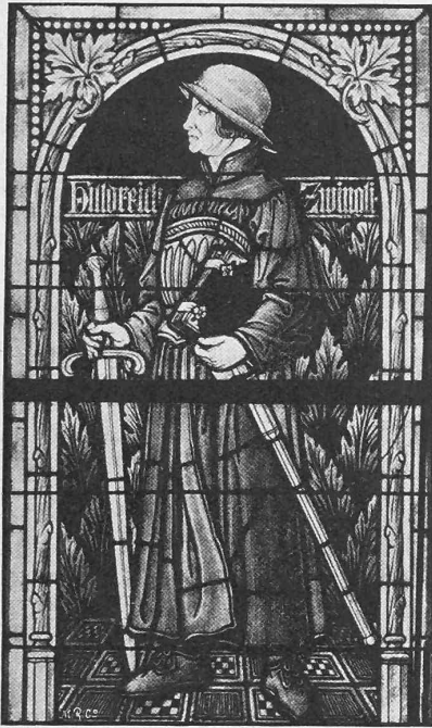
Abb. 8. Zwinglifenster.

Glasgemälde von A. Lüthi in Frankfurt a. M.