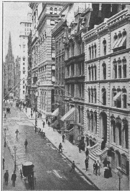
Abb. 11. New-York. — Wall Street.

mässig in rechtwinkligen Blocks von verschiedener Grösse, beispielweise solchen von 65/178\text{ m} angelegt; sie sind breit und mit Asphaltplaster versehen, ohne Bäume. Diese finden sich dafür um so reichlicher in den grossen Squares, welche die Strassen zuweilen unterbrechen. Eine Eigentümlichkeit, die dem Fremden auffällt, ist, dass auch in reinen Geschäftsquartieren, ein breiter Streifen Landes vor den Häusern zu diesen gehört, oft mit dem Trottoir