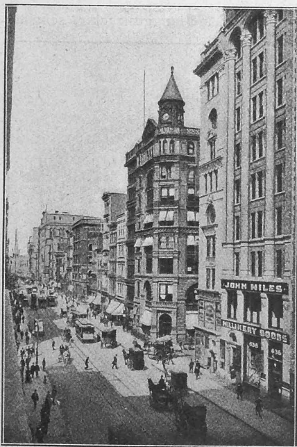
Abb. 10. New-York. — Broadway.

viele der neuern geradezu hervorragende architektonische Leistungen mit viel Sinn für Gesamtwirkung und grossem Geschmack in der Detailausbildung. Man sieht, sie haben da drüben nicht nur die Mittel zur Ausführung bedeutender Bauten, sondern auch ein energisches Streben, dem nichts Kleinliches anhaftet, und dazu sehr gut geschulte Architekten. Es ist das aber auch kein Wunder bei diesem Reichtum und dieser Anlage fürs Grosse, die die ganze Stadt charakterisieren.