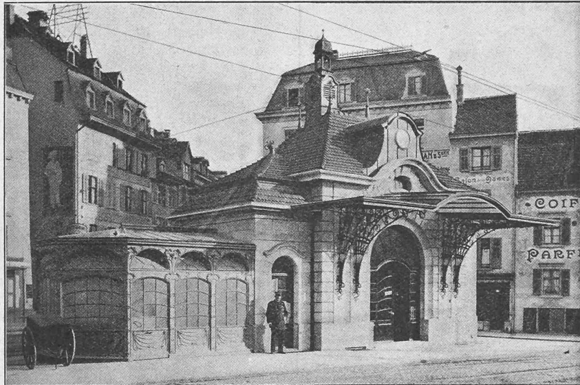
Abb. 1. Vorderansicht.

Das Stationsgebäude umfasst getrennte Warteräume für das Publikum und das Personal, sowie ein Bureau für den Stationsmeister und ein Verkaufslokal.