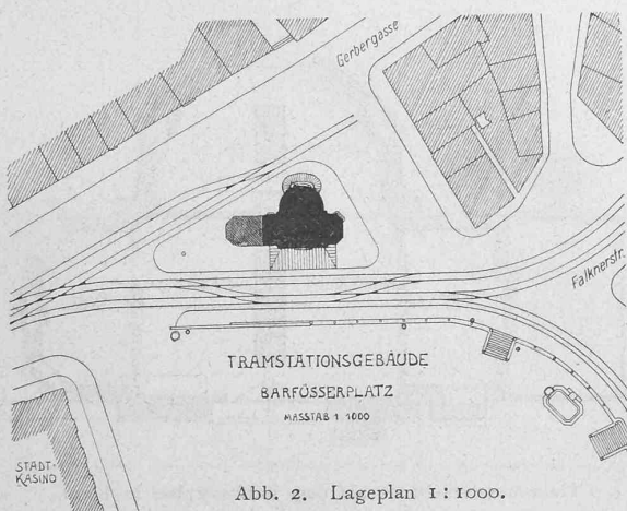
Abb. 2. Lageplan 1:1000.

Die ausreichende Tagesbeleuchtung wird durch im Erdgeschossboden eingelassene Tafeln mit Luxferglasfließen und in den Fenstern angebrachte Luxfermarquisen bewirkt. Für die im Trottoir eingelassenen Oberlichtplatten wurden besonders starke Falconierglasbausteine verwendet.