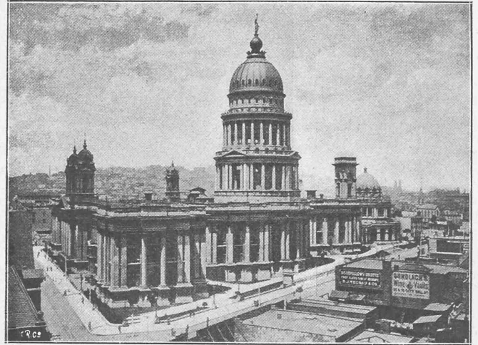
Abb. 72. San Francisco. — City Hall.

Als wir bei der letzten Nachtfahrt eben zu Bett gehen wollten, bot sich uns nochmals ein Schauspiel, das einen grossen Eindruck auf uns machte. In nicht gar weiter