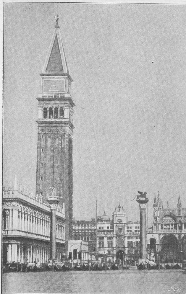
Der Turm von San Marco von der Piazzetta aus gesehen.