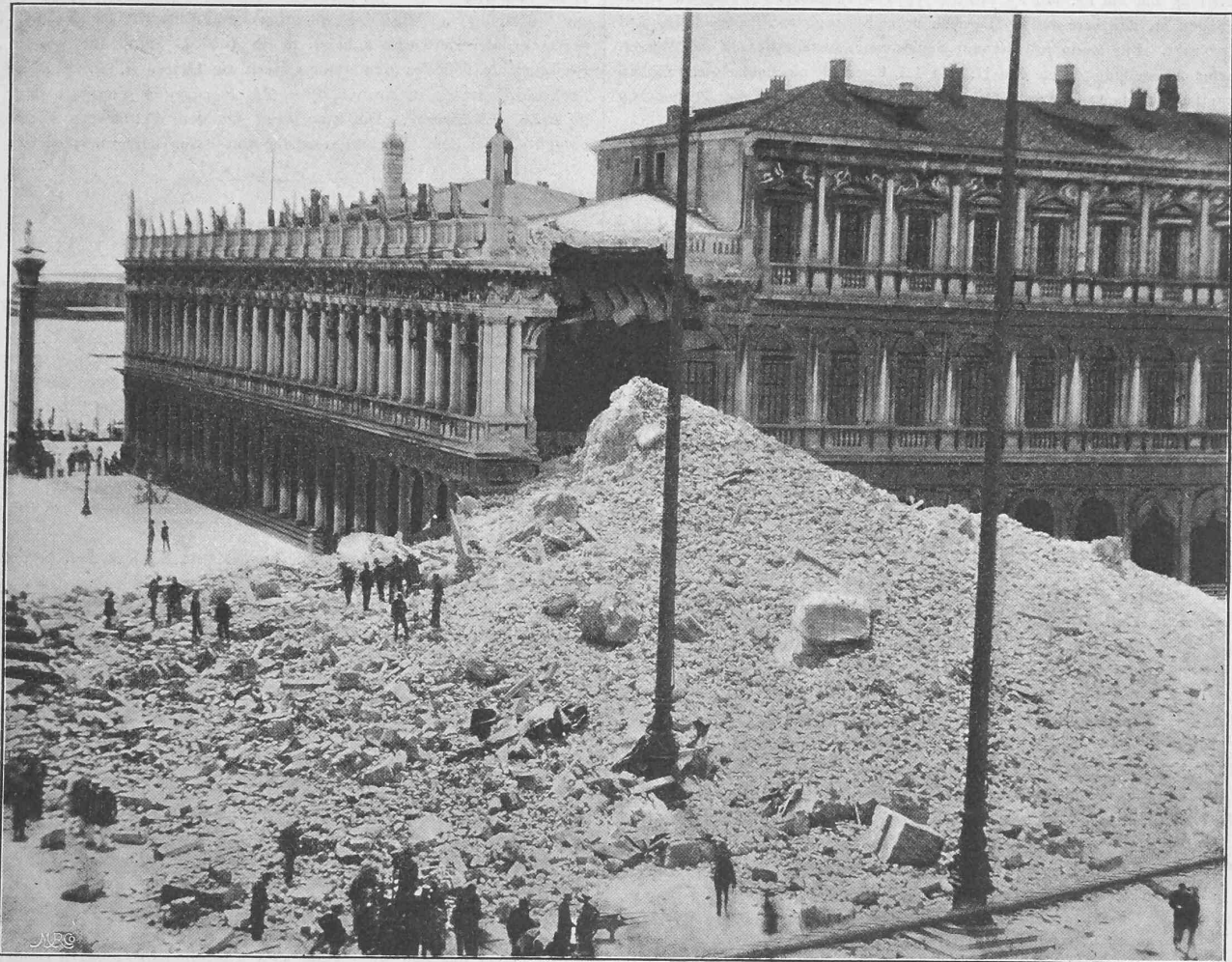
Nach einer Photographie.