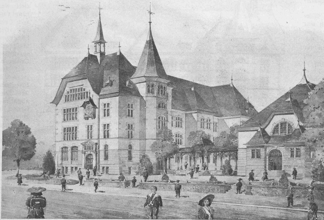
I. Preis. Motto: «Süd-Ost-Licht». Verfasser: Ernst Fröhlicher, Architekt in Solothurn. Perspektive.

britannien 2, Italien 3, Japan 4, Monako 1, die Niederlande 4, Norwegen 1, Oesterreich 20, Paragnay 1, Rumänien 3, Russland 5, Schweden 3, die Schweiz 1, Spanien 3, die Türkei 1, Ungarn 9, die Vereinigten Staaten von Amerika 3. Dazu kamen die zahlreichen Vertreter von Behörden, Körper-