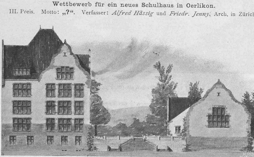
Nordfassade gegen die Hochstrasse. 1:500.

Der Betriebsvoranschlag weist für den zwölf Zellen-Betrieb eine jährliche Gesamtausgabe von 131967 Fr. auf, der 41220 Fr. Einnahmen gegenüberstehen; der 90747 Fr. betragende Ausgabenüberschuss wird durch den Ertrag der Kehrichtabfuhrtaxe und die Entschädigung des Strassenwesens für die Verbrennung des Strassenkehrichts hinlänglich gedeckt. Die Beseitigung des Kehrichts durch landwirtschaftliche Verwertung kostete in den letzten vier Jahren in Zürich durchschnittlich 6,15 Fr. per t, durch Verbrennung wird sie zunächst auf Fr. 6,78 zu stehen kommen, welche