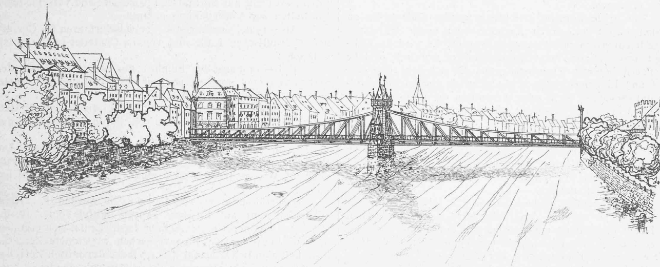
Nach einer Zeichnung von Arch. A. Visscher

der Schweizerischen Bundesbahnen. Neubau der mittleren Rheinbrücke in Basel. — Nekrologie: † Robert Drossel. — Litteratur: Bericht über die Thätigkeit der königl. techn. Versuchsanstalten im Rechnungsjahre 1900. Zeitungskatalog für 1902 der Annoncen-Expedition Rud. Mosse. Eingeg. litterar. Neuigkeiten. — Korrespondenz. — Vereinsnachrichten: Zürcher Ingenieur- und Architekten-Verein. G. e. P.: Stellenvermittlung. Hiezu eine Tafel: Wettbewerb f. d. Neubau d. mittl. Rheinbrücke zu Basel.