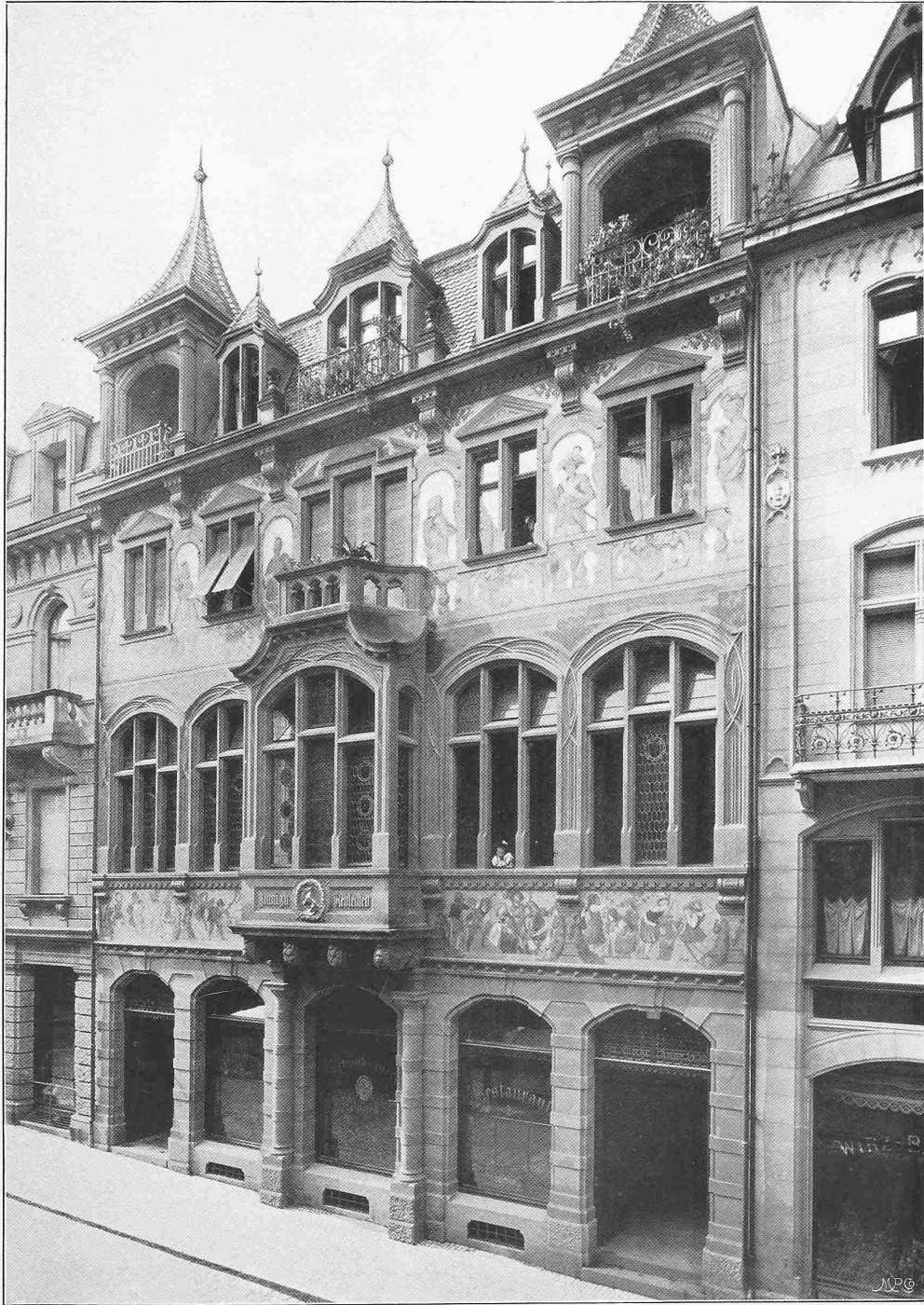
Die Freie Strasse in Basel. — „Zunft zu Rebleuten“.

Architekten: La Roche, Stähelin & Cie. in Basel.