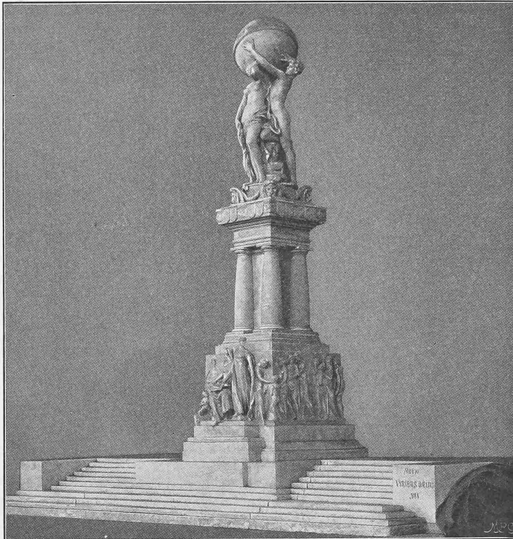
I. Preis « ex aequo ». Verfasser: Professor E. Hundrieser in Charlottenburg.

Das noch nicht veröffentlichte, uns in Aussicht gestellte Gutachten des internationalen Preisgerichtes denken wir in einer unserer nächsten Nummern zur Kenntnis unserer Leser bringen zu können.