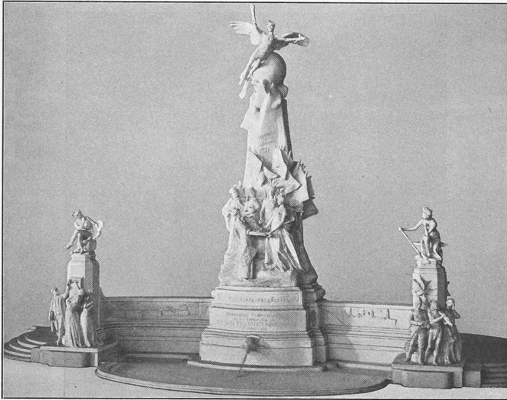
I. Preis «ex aequo». Verfasser: Ernest Dubois und René Patouillard in Paris.

so tief hinabgegangen, dass von der Mauerkante bis zum Terrainschnitt mindestens eine Horizontalabstand von 2 bis 3 m erzielt wurde. Noch tiefer musste man natürlich da gehen, wo zu befürchten war, dass die Terrainoberfläche durch Rufen in jüngerer Zeit erhöht worden sei.