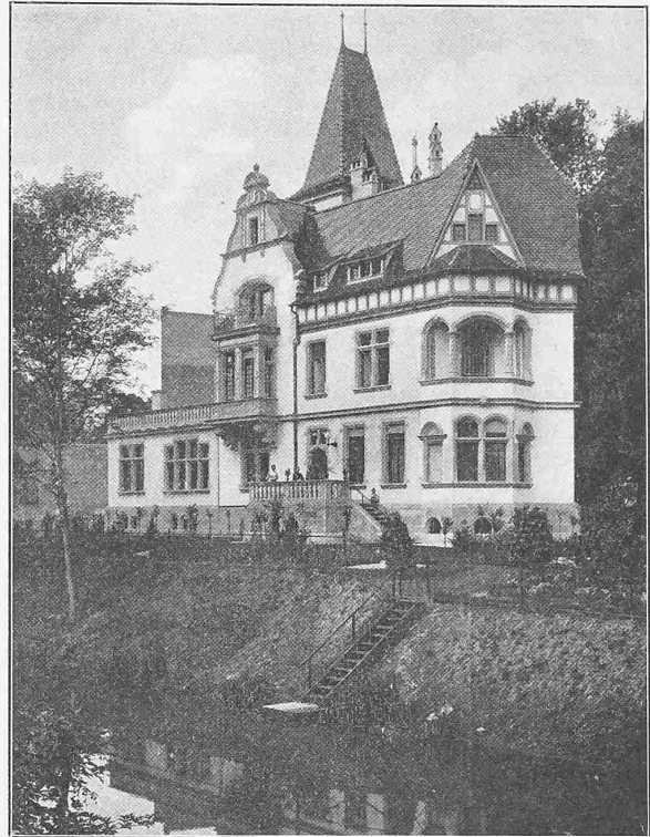
Abb. 2. Ansicht gegen die Aar.