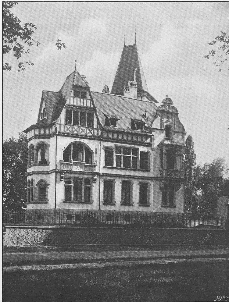
Abb. 1. Ansicht gegen die städtische Anlage.

Die Malz-Silos der Aktienbrauerei zum Löwenbräu in München, die zur Zeit von der Firma Eisenbeton G. m. b. H., abweichend von dem ältern Gebrauch derartige Getreide- und Malzspeicher in Holz, in Eisen und Holz oder in Eisen allein zu erstellen, in Eisenbeton erbaut werden, sollen zur Aufnahme von 37500 hl Malz in 18 Zellen von je 16 m mitt-