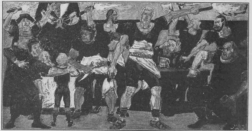
Die Mordnacht von Luzern. — Entwurf von Joh. Bossard aus Zug.

mischen Desinfektion befinden sich eine Waschvorrichtung und ein Mottscher Ausguss.