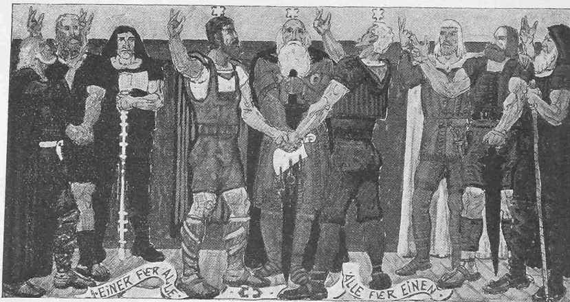
Der Bundesschwur. — Entwurf von Joh. Bossard aus Zug.

Der das letzte Quartal des Jahres 1902 umfassende siebzehnte Vierteljahresbericht über den Stand der Arbeiten am Simplon-Tunnel, vom 24. Januar datiert, ist soeben erschienen. Vom 1. Oktober bis zum 31. Dezember 1902 hat auf der Nordseite der Fortschritt im Richtstollen des Haupt-