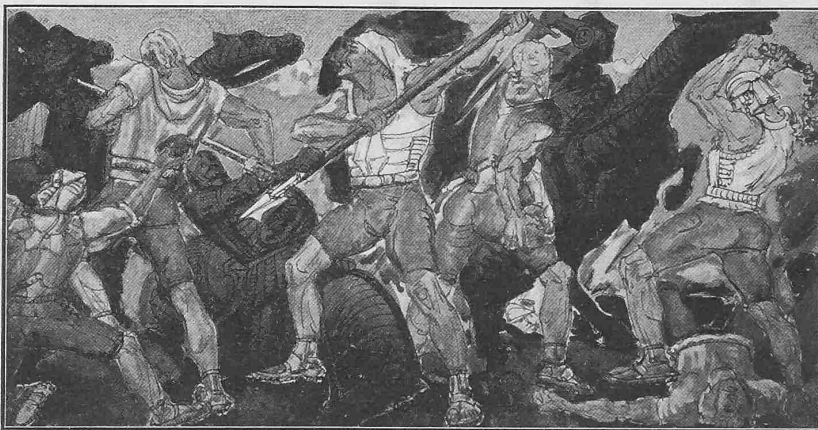
Die Schlacht bei Näfels. — Entwurf von Joh. Bossard aus Zug.

Der mittlere Stollenquerschnitt für die drei Monate wird auf der Nordseite für den Richtstollen mit 5,9 m 2 , für den Parallelstollen mit 6,0 m 2 angegeben, in den entsprechenden Stollen der Südseite betrug derselbe 5,6 m 2 bzw. 5,8 m 2 . In den beiden Stollen arbeiteten durchschnittlich auf der Briegerseite je drei Bohrmaschinen während 89 Tagen, auf der Seite von Iselle je 3,1 Bohrmaschinen im Richtstollen während 89 Tagen und im Parallelstollen während 111,5 Tagen. Die Gesamtzahl der Bohrangriffe betrug in beiden Stollen zusammen nordwärts 852 und südwärts 1038. Mittels mechanischer Bohrung wurden im ganzen aus den vier Stollen 12 121 m 3 Material gefördert, wozu 58 622 kg Dynamit und 89 156 Arbeitsstunden verwendet worden sind. Von letzteren entfallen 4390,3 Stunden auf die eigentliche Bohrarbeit und 4525,3 Stunden auf das Laden der Schüsse und die Schutterarbeit.