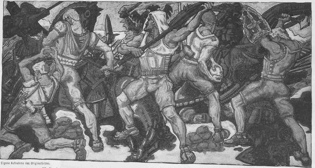
Eigene Aufnahme des Originalbildes.