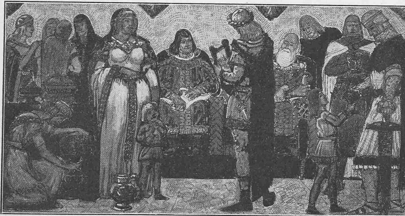
Manesse und Hadlaub. — Entwurf von Joh. Bossard aus Zug.

Sämtliche Räume haben Ausgänge ins Freie. In die Zwischenwand zwischen den Räumen für infizierte und desinfizierte Gegenstände ist ein grosser Desinfektionsapparat und ein Merkescher Wäschesammel- und Desinfektionsapparat (Abb. 13 S. 80) eingebaut; in der Chemischen Desinfektion befinden sich eine Waschvorrichtung und ein Mottscher Ausguss.