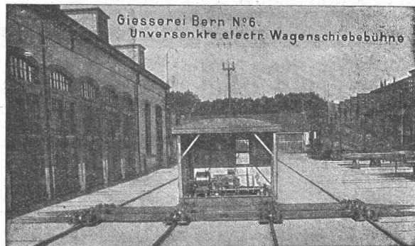
Giesserei Bern N o 6. Unversenkte elektr. Wagenschiebebühne

Hebezeuge jeder Art als Laufkräne , und feste oder fahrbare elektrischen Betrieb ; Drehkräne für Hand- und speziell Aufzüge für hydraulischen, elektrischen und Transmissionsbetrieb.