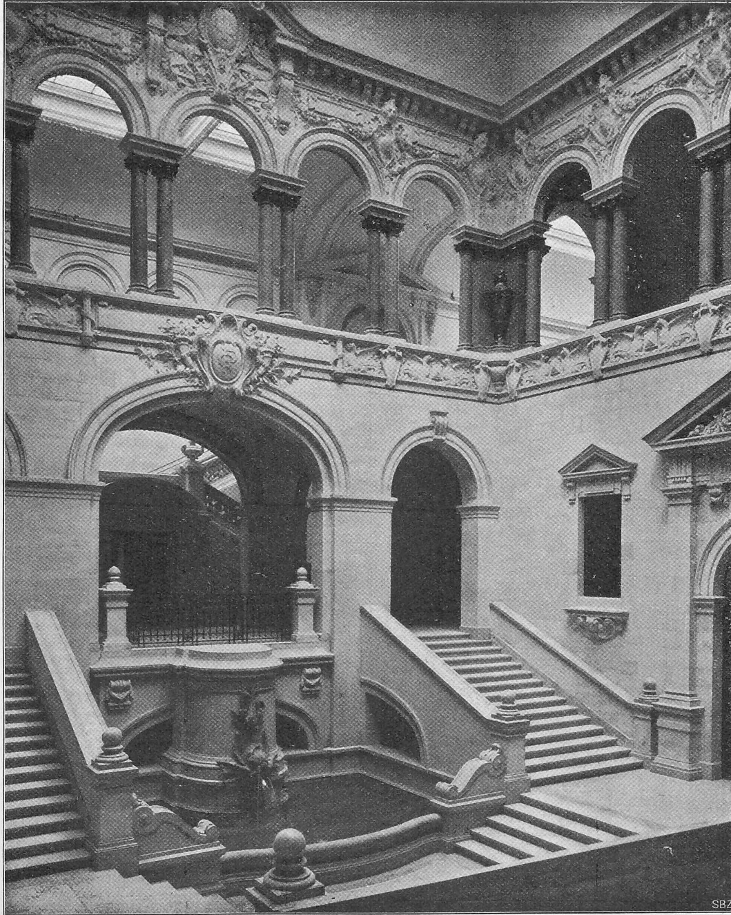
Photographie de F. de Jongh à Lausanne.

Autotypie de Meisenbach, Riffarth & Cie. à Munich.