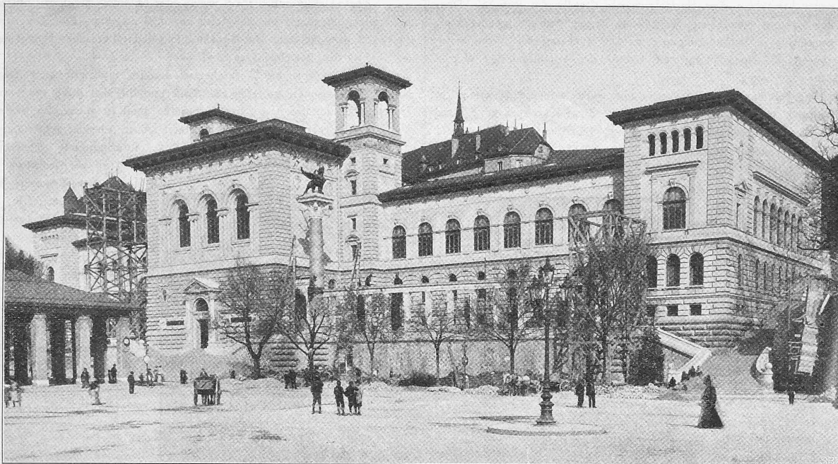
Fig. 2. Vue principale du Palais de Rumine.

Architectes: MM. Meley, Isoz, Bezencenet et Girardet à Lausanne.