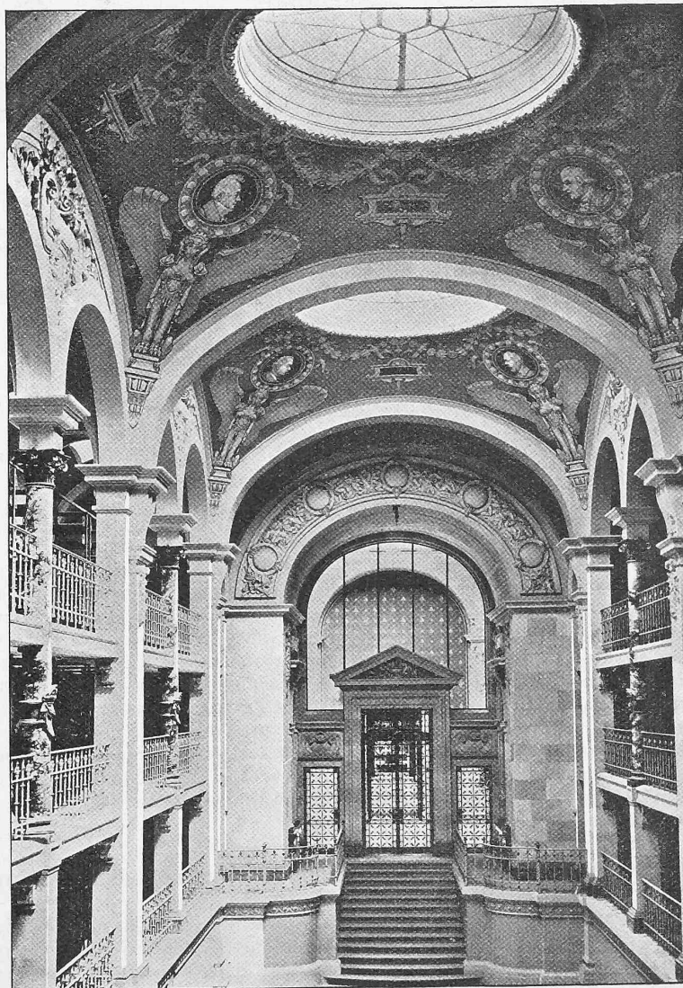
Fig. 5. Bibliothèque cantonale dans le Palais de Rumine à Lausanne. 1) Architecte: M. Melley à Lausanne.