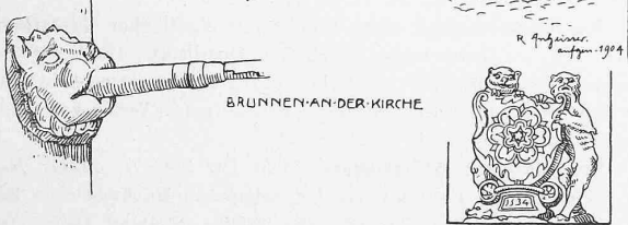
Brunnen an der Kirche zu Estavayer mit Details.