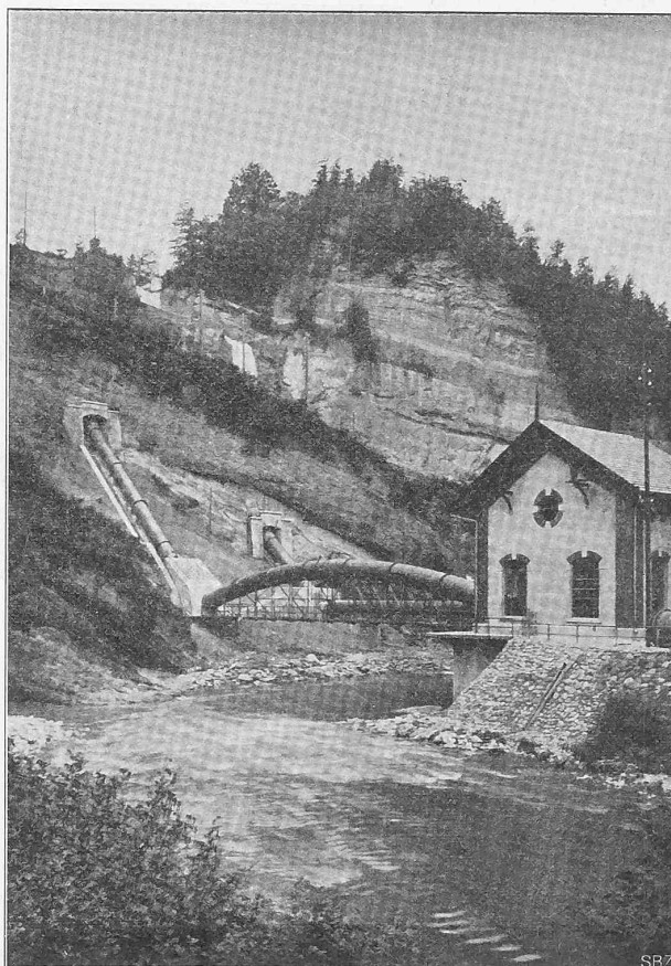
Abb. II. Ansicht des Maschinenhauses mit der zweiten Druckleitung.

Mauerkrone hinüber geführt würde. Allerdings kann der Weiher mittels dieser Ausführungsweise nur um etwa 7 m gesenkt werden, was indessen wenig zu sagen hat, da der tiefer liegende Teil des Weierinhaltes nur noch 400000 m 3 beträgt und eine tiefere Absenkung bisher überhaupt noch nicht vorgekommen ist; die ganze Entleerung kann aber jederzeit mittels der alten Leitung erfolgen.