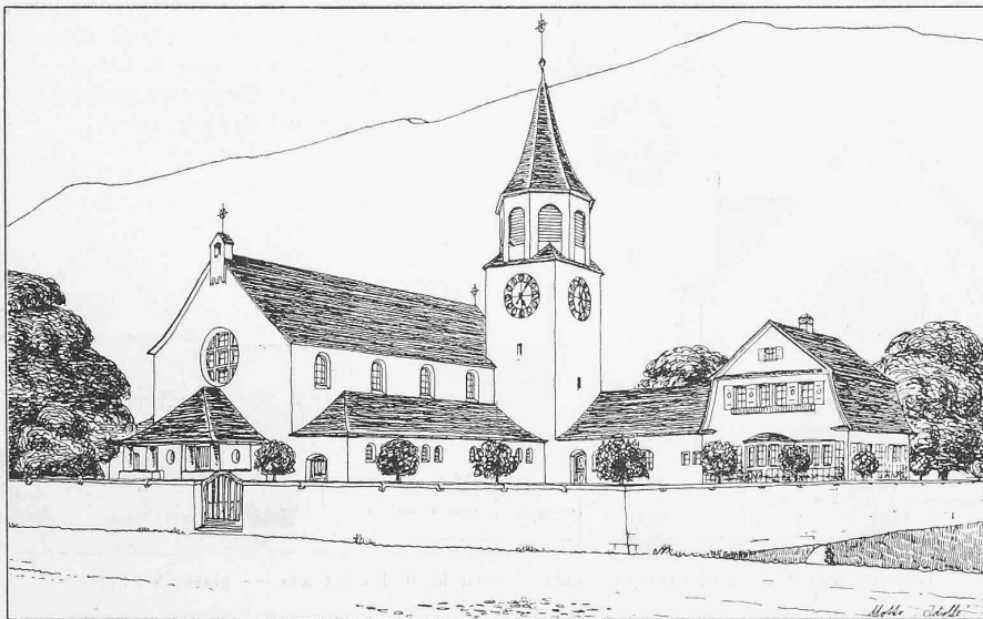
Schaubild von Kirche und Pfarrhaus von Westen.