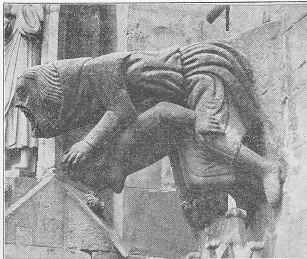
Abb. 3. Wasserspeier an der südlichen Langhausfassade.