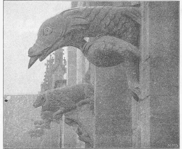
Abb. 2. Wasserspeier an der nördlichen Langhausfassade.

die Spannweiten sind so gegen einander abgestimmt, dass die Horizontalschübe für Eigengewicht gleich werden, wodurch die Pfeilerstärke am Kämpfer auf das Mindestmass von 3 m beschränkt werden konnte. Die Mittellinie der Gewölbe fällt mit der Drucklinie für Eigengewicht zusammen. Ausserdem sind zwei weitere Entwürfe in Massivbau (ähnliche Abmessungen in Eisenbetonkonstruktion) angekauft worden. Erfreulicherweise haben die Mülheimer Stadtverordneten dem Vorschlage des Preisgerichts zugestimmt, wodurch die Ausführung des an erste Stelle gesetzten Projektes, dessen Kostenvoranschlag rund 820 000 Fr. erreicht, gesichert ist.