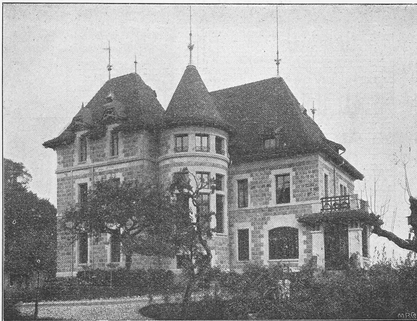
Fig. 3. La villa Diserens au Signal près Lausanne. Architecte M. Louis Bezzenet, Lausanne.

Un architecte dont nous avons déjà signalé les œuvres dans l'étude de l'architecture moderne de Lausanne, M. Louis Bezzenet, a cherché un groupement pittoresque des masses dans sa villa Diserens au Signal. Le plan est