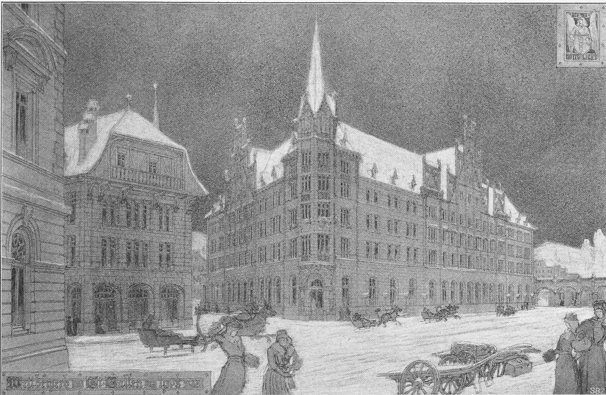
Schaubild des Postgebäudes von Norden.

III. Preis «ex aequo». — Motto: «Licht». — Verfasser: Architekten Montandon &amp; Odier in Genf.