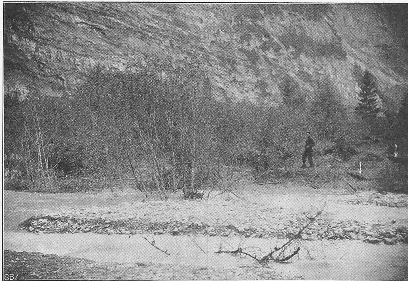
Abb. 4. Einsenkungsstelle in der Richtung senkrecht zur Tunnelachse gesehen. (Blick gegen S. W.)

Manometer ohne weiteres gemessen werden kann. Zum Schluss sei noch erwähnt, dass das vielbesprochene Umgehungs-tracé, den Tunnel ungefähr bei Km. 1,100 mit einer Kurve von 1100 m Radius (was bei 60 km/Std. Geschwindigkeit noch keine Ueberhöhung, infolgedessen keine Profilerweiterung notwendig macht) in östlicher Richtung abbiegend verlassen würde. Der «Brandhubel» (vergl. Abb. 1), wo zuerst im Bachbett der Granit anscheinend ansteht, würde mit einer Kurve von gleicher Krümmung umfahren und in südlicher Richtung ungefähr unter dem Lötschenpass das jetzige Tracé wieder erreicht. Je nach der gewählten Umfahrungsstelle beim Brandhubel würde die Verlängerung des Tunnels 730 bis 940 m betragen, die Mehrkosten bei 3150 Fr. für den laufenden Meter demgemäss 2,3 bis 3 Millionen Fr.; die Verlängerung der Bauzeit kann auf Grund der bisher erzielten Leistungen auf fünf bis sieben Monate geschätzt werden. Wie verlautet, sollen je nach dem Ergebnis der zunächst in der geraden Tunnelrichtung bei Km. 2,700 und 2,870 angeordneten Bohrungen auch beim Brandhubel weitere Bohrungen vorgenommen werden, um die eventuelle Umfahrungsstelle zu bestimmen.