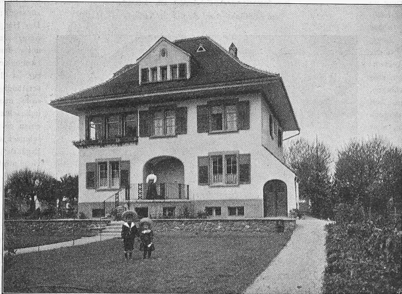
Abb. 7. Gartenansicht des Einfamilienwohnhauses in Thun.