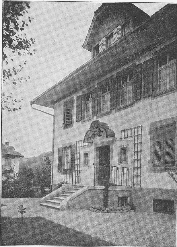
Abb. 8. Ansicht von der Strassenseite.