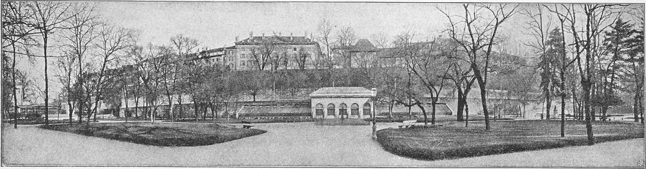
Ansicht der «Promenade des Bastions» mit dem «Mur des Réformateurs». In der Mitte die Orangerie; darüber das Hôtel de ville.