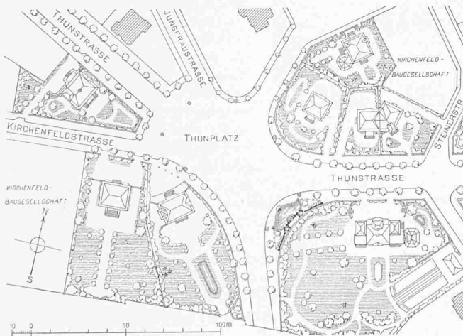
Abb. 1. Lageplan des Thunplatzes mit der Brunnenanlage. — 1 : 2500.

Indem der deutsche Berichterstatter sich über die Sachlage im Hinblick auf Deutschland äussert, schreibt er: «Bedauerlich ist dabei die hohe Einfuhrziffer, wenn auch anerkannt werden muss, dass in Deutschland für manche Arbeit nicht der geeignete Stein zu finden ist und somit aus dem Ausland bezogen werden muss. Die Statistik zeigt aber auch, dass heute noch grosse Summen für Steine ins Ausland wandern, die aus dem Inland bezogen werden können. Es muss nun, und dies muss immer und immer wieder gesagt werden, unsere Aufgabe sein, die interessierten Kreise darauf aufmerksam zu machen. Es ist im Sinne einer gesunden, nationalen Volkswirtschaft, soviel wie irgend möglich den Bedarf, der im eigenen Lande