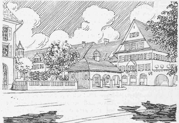
Abb. 17. Blick von Süden in den Platz R an der Kreuzung der Buchegg- und Rötelstrasse.

auch das Bauland weniger vorteilhaft aufschliesst als bei Entwurf Nr. 16 (vergl. Profil I und Plan auf Seite 225). Auch mit Rücksicht auf etappenweise Bauausführung dürfte sich das Festhalten an jenem Höhenpunkt 514 und damit an der alten Waidstrasse empfehlen. Andererseits hat die tiefere Lage des Platzes im Entwurf Nr. 20 zur Folge, dass das Spitalareal weiter südlich begrenzt wird, somit eine weniger in die Länge gezogene Form erhält, als bei den Entwürfen Nr. 16 und 31, die beide etwas von dem Gehölz in Anspruch nehmen.