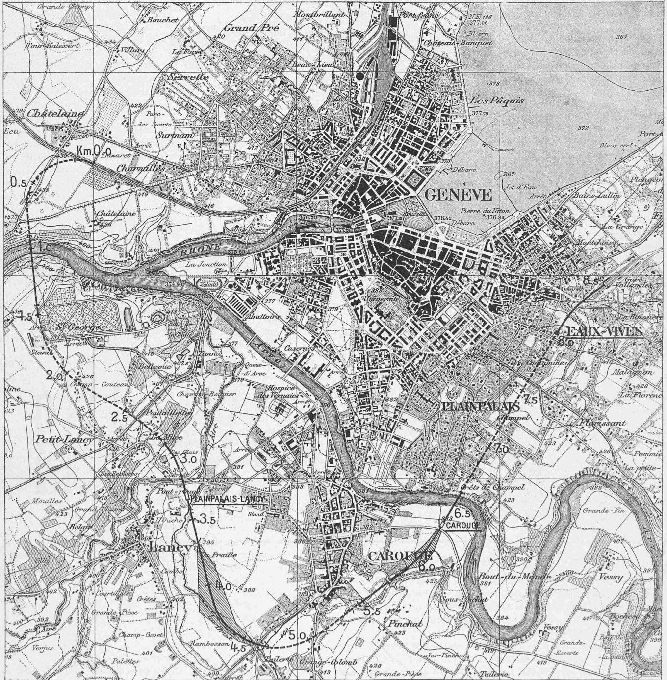
Mit Bewilligung der Schweizerischen Landestopographie vom 26. Juni 1912. Genfer Verbindungsbahn. — Uebersichtskarte 1 : 25 000. — Längenprofil Châteline-Eaux-Vives; Masstab 1 : 50 000 und 1 : 25 000.