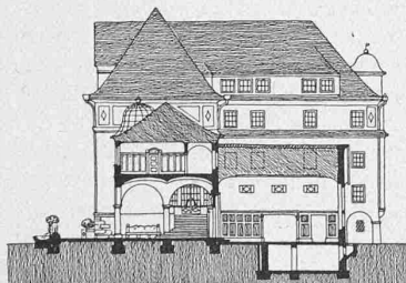
Entwurf „Sparsam“ Querschnitt durch Spielhalle und Turnhalle. Längsschnitt durch Seitenflügel und Turnhalle. Masstab 1 : 800.

Weil wir (wie auch unsere Nachbarländer) auf italienische Arbeiter angewiesen sind und Rohmaterialien vom Ausland beziehen müssen, sollten wir auch darauf verzichten die Arbeit durch eigene intellektuelle Kräfte auszuführen!? Auf die vom Redner befürchteten „diplomatischen Reklamationen“ sollten wir doch auch eine freundnachbarliche diplomatische Antwort zu geben im Stande sein. Und dann der Gotthardvertrag! Wusste der Redner nicht, dass ein solcher Vertrag nur als Antrag des Bundesrates vorliegt