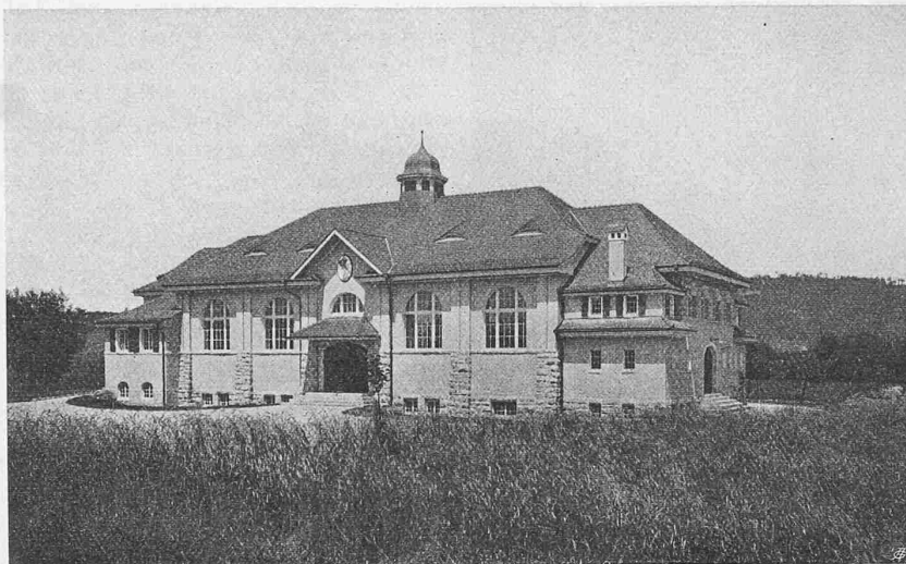
Abb. 1. Turnhalle in Windisch, Ansicht von Südost.

den beiden Stockwerken in den Rauputz eingelassene Medaillons mit den Bildnissen römischer Kaiser (Tafel 16). Sie sind im Stil römischer Münzen von Bildhauer Wehrli in Aarau modelliert und in Terranova gegossen. Die Bildhauerarbeiten, so namentlich die säugende Wölfin an der Südostecke des Gebäudes sind modelliert von Bildhauer Hinrichsen in Berlin und in Jurakalk ausgeführt von Gebr. Schwyzer in Zürich.