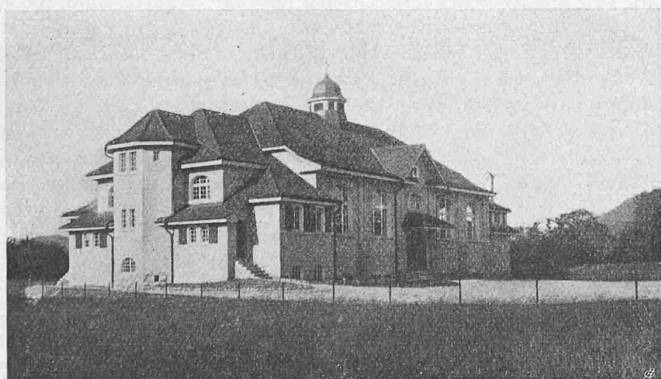
Abb. 2. Turnhalle in Windisch. Ansicht von Südwest.

Im Anschluss an vorstehende Darstellung des Vindonissa-Museums seien hier noch einige Angaben gemacht über den ländlichen Saalbau, den der gleiche Architekt, Alb. Froelich , in nächster Nähe, in Windisch selbst erbaut hat. Wie die Zeichnungen zeigen, ist die Gelegenheit eines Turnhallebaues dazu benützt worden, der Gemeinde einen allgemein verwendbaren Versammlungssaal zu verschaffen. Zu diesem Zwecke ist an einem Ende des rechteckigen Turnsaals eine Bühne mit Garderoben und selbstständigen Zugängen angebaut worden. Durch Luken mit der Bühne in Verbindung befindet sich über ihr ein