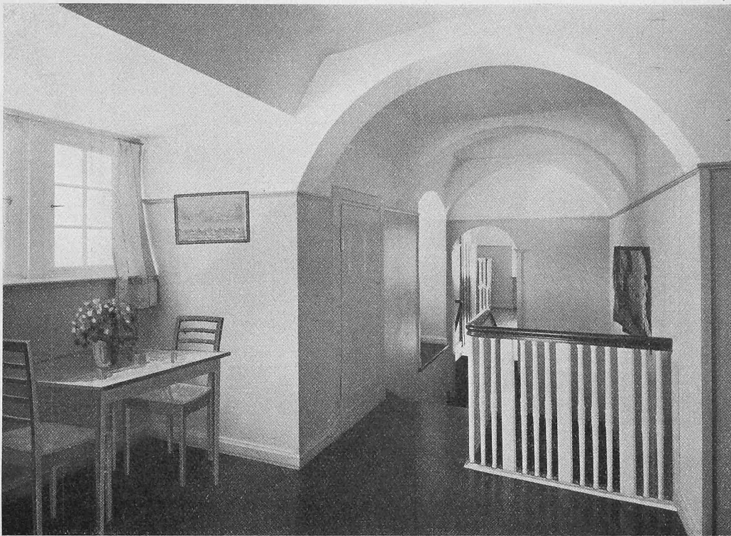
Abb. 2. Oberer Flur eines Landhauses in Schlachtensee bei Berlin. Aus dem Werk «Landhäuser» von Hermann Muthesius.

tümlichkeiten des jeweiligen Bauplatzes berücksichtigt, dem ortsüblichen Baumaterial Rechnung getragen, die Wünsche und Lebensweise des Bauherrn und seiner Angehörigen aufs eingehendste studiert und daraus ein Bauorganismus entwickelt, der eine Persönlichkeit darstellt. Allen diesen Häusern gemeinsam ist der Zug nach grossen Hauptaufenthaltsräumen, die sorgsam nach Himmelsrichtung und Aussichtslage angelegt sind. Mit ausserordentlichem Geschick sind Küche, Anrichte und alle jene grössern und kleinern Nebengelasse angeschlossen, die unserm anspruchsvollern oder bescheideneren Bedürfnis nach Bequemlichkeit, Ordnung und Hygiene dienen müssen. Kein Winkel bleibt unbenutzt, keine Ecke ungelöst. Wie Fenster und Türen in der Wand sitzen, die Treppen sich hinaufdrehen, die Räume gegeneinander