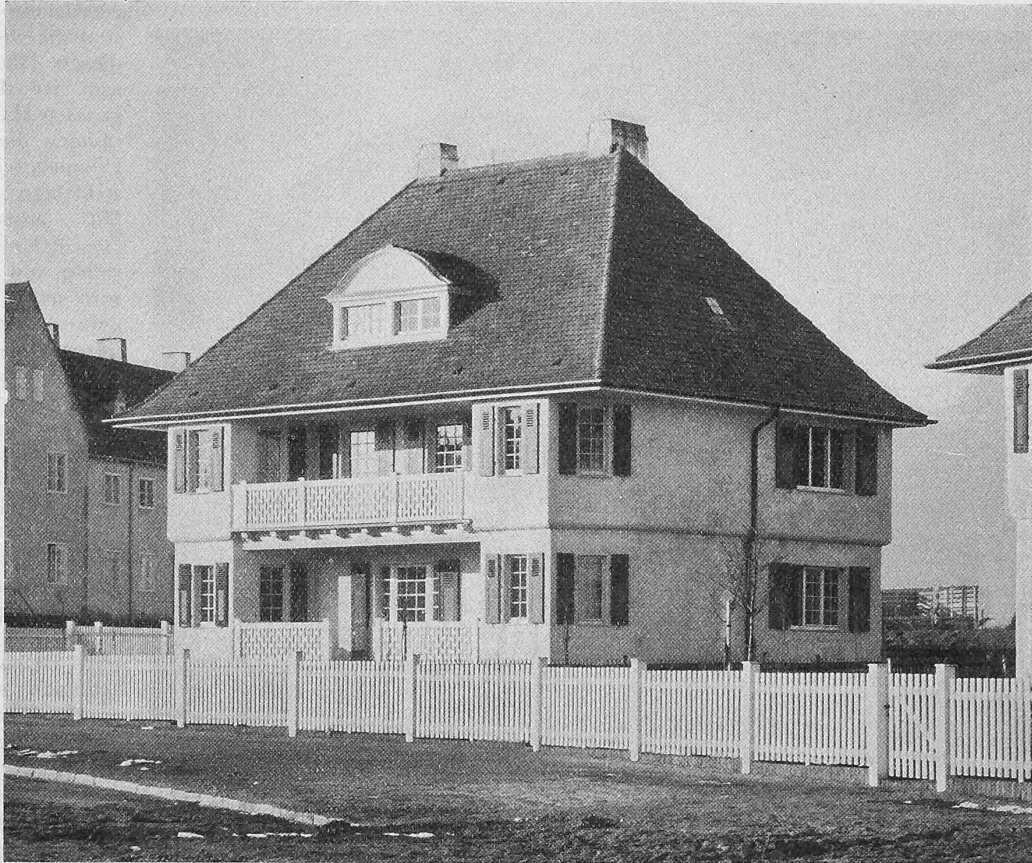
Abb. 3. Zweietagenhaus in der Gartenstadt Hellerau.

Verlag von F. Bruckmann A.-G. in München.