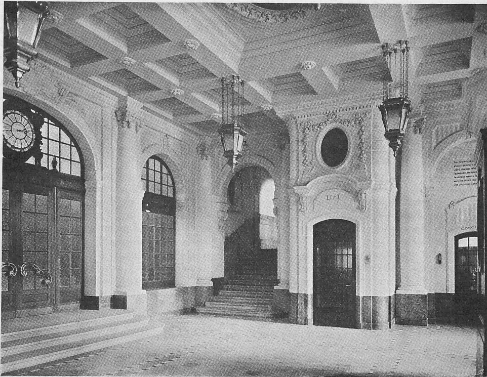
Abb. 7. Eingangshalle im Erdgeschoss.

Wenn wir den Ingenieur, nicht nur den Spezialisten im Vermessungswesen, sondern jeden vermessenden topographierenden Techniker in diesem Geiste ausbilden und entwickeln möchten, so geschieht das nicht bloss, um ihn zu der Aufnahmearbeit als solche besser zu befähigen. Er soll im allgemeinen seinen Sinn, sein Verständnis für Terrainformen und Erscheinungen schärfen, damit er beim Bauen in dieses Terrain hinein den höher entwickelten bildnerisch-schaffenden Sinn betätige. Ist dieses Bauen ja nicht auch ein Bilden? Die Bauten, die wir in das Terrain legen, sollen diesem nichts Fremdartiges sein; sie sind im Grunde ja nur technische Vervollkommnungen dieses Bodens, dass man auf ihm besser gehen, fahren und wohnen kann, dass die Wasser einen rationelleren Lauf bekommen und man ihnen die Kräfte abnehmen kann, dass sich tote Massen bewegen können? Unsere technischen Werke sollen so ausgeführt sein, als ob sie natürlich aus dem Boden selbst, mit demselben, gewachsen wären, dass sie zum mindesten den Naturformen nicht zuwiderlaufen. Eine Bergbahn oder Strasse soll sich an einem Berge hinaufwinden, mit einem Minimum an Mitteln und einem Maximum an Festigkeit, wie sich eine Kletterpflanze am Felsen hinaufrankt, wie die Wurzeln eines Baumes an einem Steilhang sich in den Boden klammern. Dann wird das Bauwerk auch schön werden und was noch