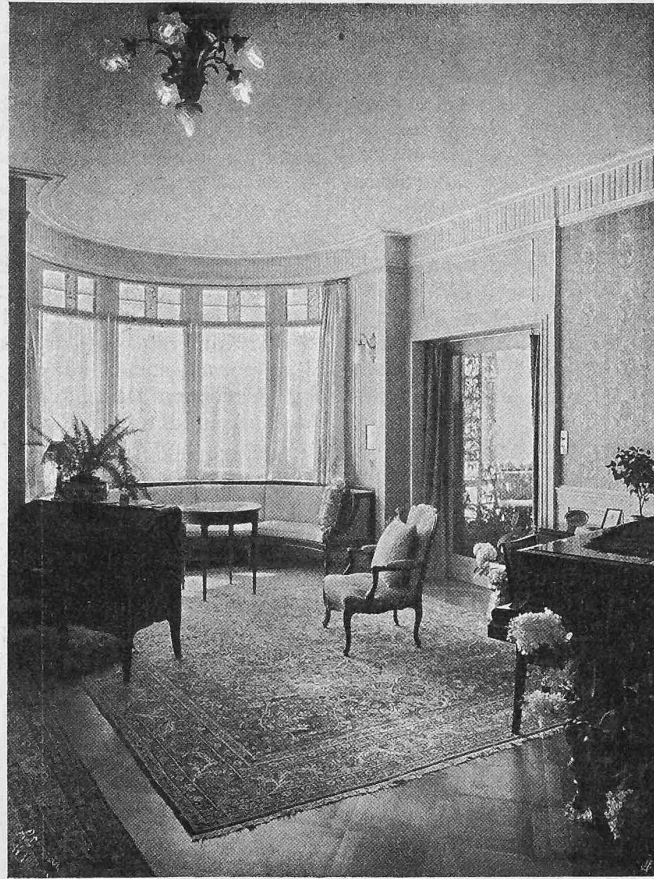
Abb. 7. Blick in den Erker des Wohnzimmers.

hier wie von der östlichen Eckveranda öffnet sich die offene Sommerwohnung, der Garten, dem die Architekten die aus dem Lageplan (Abb. 1) ersichtliche Durchbildung gegeben haben. Ueber die Rasenterrasse und die unterhalb sich breiten Wiesen hinweg genießt man eine weite Fernsicht auf das Alpsteingebirge. Schmale Fusswege aus dunkelroten Melser-Platten durchziehen den Rasen und ermöglichen beliebige Abkürzungen, ohne die für das Auge angenehmen Grünflächen so zu zerschneiden, wie es bekümmerte Wege tun. Gegen Norden, längs der eingeschnittenen Zufahrtsstrasse, sowie gegen Westen umsäumen Tannen und Gehölz das Grundstück in freier, natürlicher Weise, wogegen der Garten selbst ein ausgesprochen architektonisches Gepräge trägt. Dieses kommt nicht etwa, wie Manche meinen, in erster Linie in den geraden Linien seiner Einteilung zum Ausdruck, sondern vielmehr darin, dass sich der Garten rings um das Haus als sinngemässe Erweiterung des Haus-Grundrisses darstellt. Das allein schafft den wohltuenden engen Zusammenhang von Haus und Garten , den der Bauherr dem Umstand verdankt, dass er die ganze Planung seinem Architekten anvertraut und nicht bloss dem Gärtner oder sog. „Gartenarchitekten“ überlassen hat.