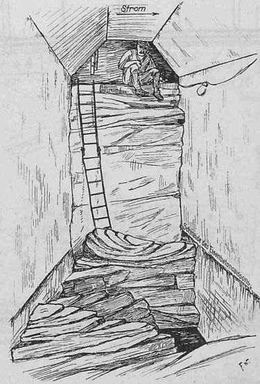
Abb. 26. Arbeitskammer im vertieften Caisson 5 b; Blick gegen Pfeiler IV.