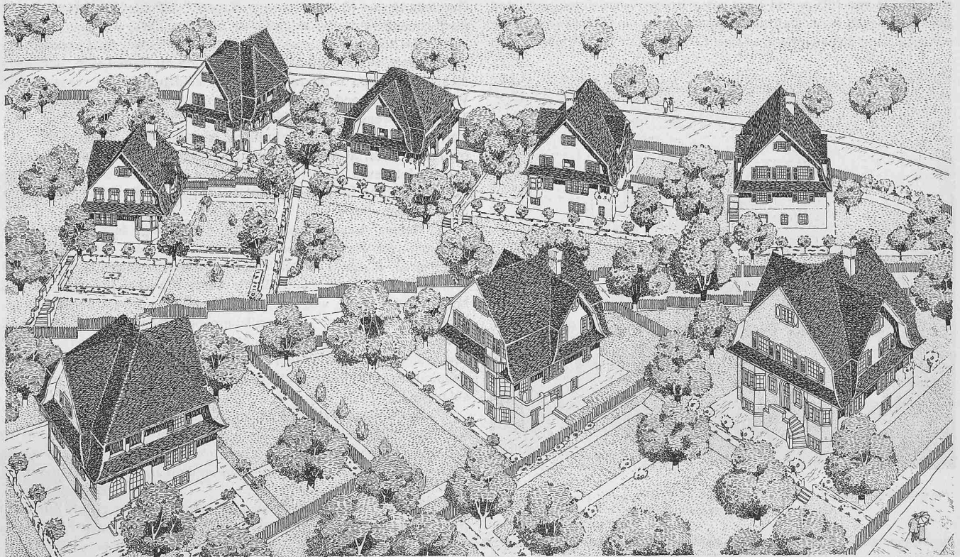
VILLENGRUPPE UF UND DY ALLE WİNDE

Es waren 15,2 km definitive Geleise und auf den Stationen zusammen 21 Weichen verlegt. Vom Geleise lagen 820 m noch auf dem Planum, 8260 m auf der ersten und 4420 m auf der zweiten Schotterlage; bis Km. 10,8 ab Frutigen lag durchgehendes Geleise. Mit Ausnahme der Stellwerkgebäude und der Lokomotivremise Kandersteg waren die Hochbauten im Rohen vollendet.