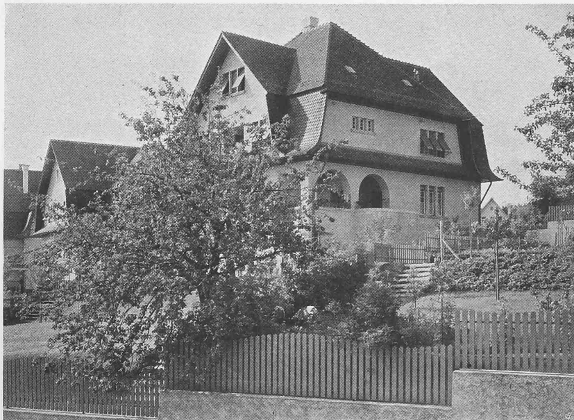
VILLENGRUPPE „UF UND BY ALLE WINDE“ IN ZÜRICH