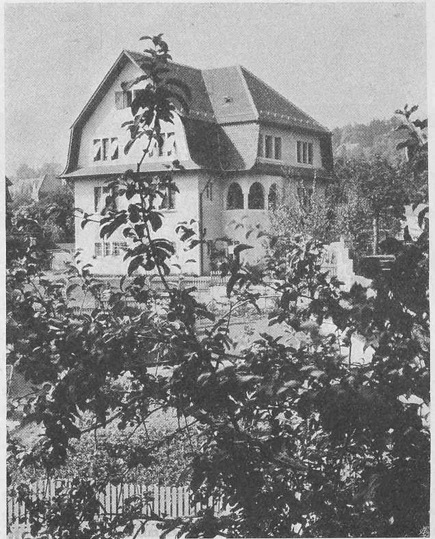
Abb. 7. Ansicht von Süden des Hauses Keltenstrasse Nr. 28.