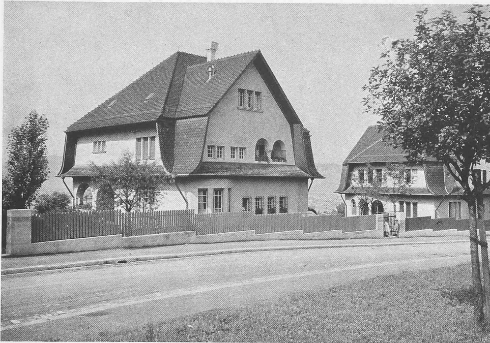
Die Häuser Keltenstrasse Nr. 30 und 28