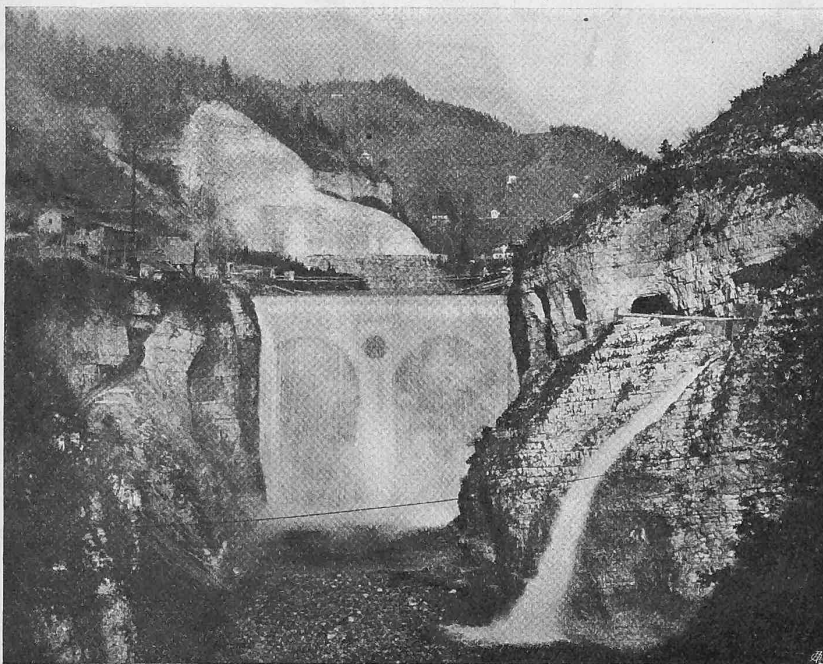
Abb. 3. Ansicht des Stauwehrs vom Ponte della Serra, von Süden.

Neben dem Einlauf des Turbinenkanals und schräg zu diesem gerichtet findet sich der Eintritt eines zweiten kurzen Stollens für Abführung von Kies und Sand. Der Einlauf dieses Stollens liegt 1,50 m tiefer als jener des Hauptstollens; seine Breite ist 2,50 m und die Höhe wechselt zwischen 6 und 4,25 m. Das Sohlengefälle dieses Kiesstollens beträgt 11,32 ‰, sodass sich eine grosse Wassergeschwindigkeit einstellt, die Kiesablagerungen darin verhindert, obwohl z. Z., d. h. solange die Sohle des Stauees noch tiefer liegt als die Einlaufschwelle, von solchen keine Rede sein kann. Bei Hochwasser kommt dieser ganze