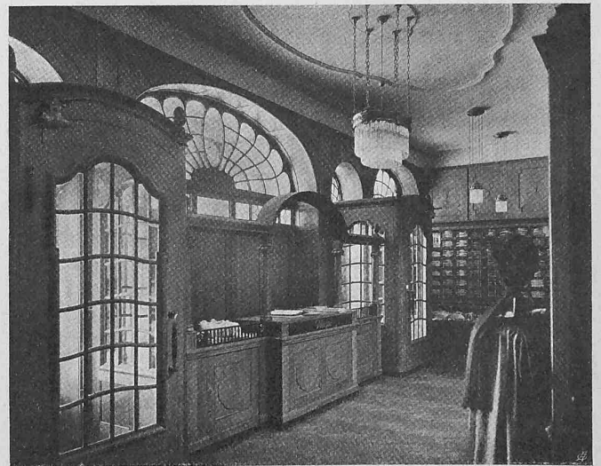
Abb. 5. Kassa im Geschäftsraum des Hauses «Au Bon Marché» zwischen den beiden Eingangstüren

Jedenfalls entwickelte sich von allen Werken des Ingenieurs am ehesten die Maschine zu einem reinen Stil, der am Beginn des laufenden Jahrhunderts so gut durchgebildet dastand, dass es üblich wurde, die sogenannte Schönheit der Maschine zu bewundern und in ihr gewissermassen die ausgeprägteste Erscheinung einer modernen Stilbildung zu erblicken. In modernen Kunstbetrachtungen spielt seit etwa zehn Jahren diese Schönheit der Maschine, an die sich gewöhnlich Betrachtungen über die sogenannte reine Zweckform knüpfen, eine gewichtige Rolle. (Schluss folgt.)